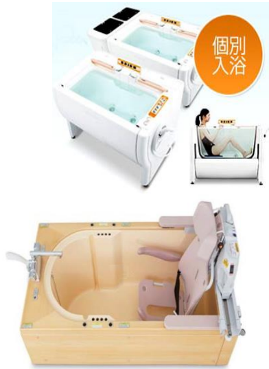
(座って入浴できる機械浴槽)